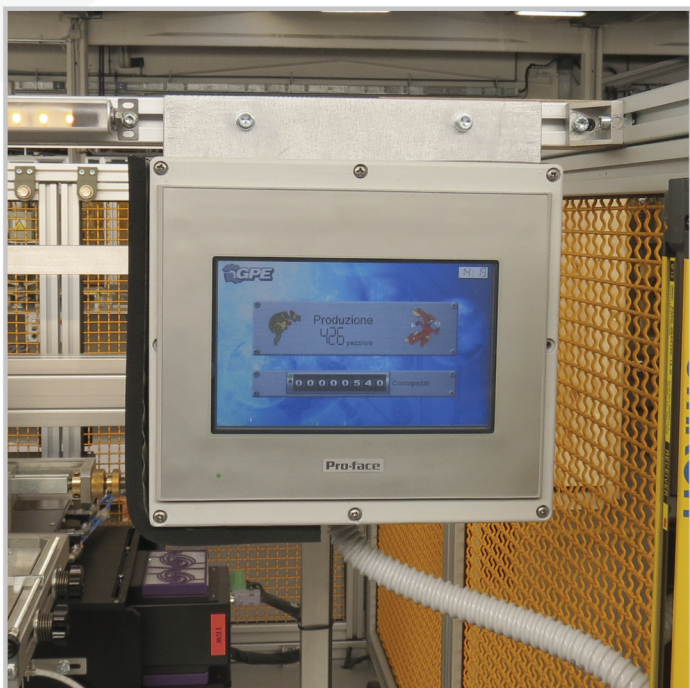
СЕНСОРНЫЙ ЦВЕТНОЙ ДИСПЛЕЙ TOUCH SCREEN WITH COLOR DISPLAY