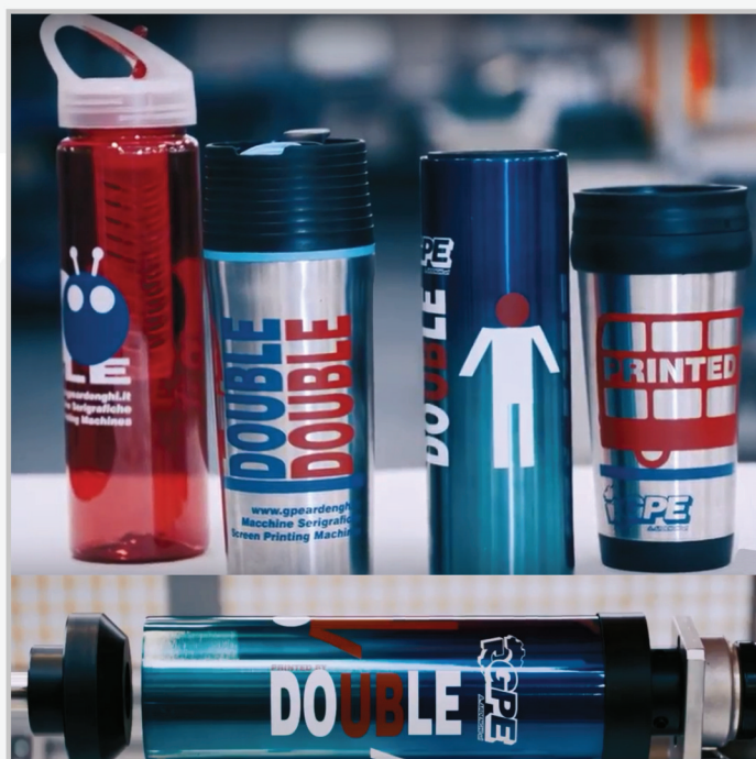
ВОЗМОЖНОСТЬ ОДНО- ИЛИ ДВУХКРАСочНОЙ ПЕЧАТИ ЗА ЦИКЛ POSSIBILITY TO PRINT ONE OR TWO COLOURS PER TIME